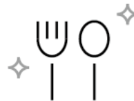
トレー・カトラリーのアルコール消毒 Alcohol Sterilization of Tray and Cutlery