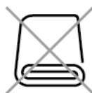
連泊時の清掃制限 Limited Cleaning for consecutive stay