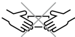
会計時における直接手渡しの中止 No Direct Hand-Over at the time of Paying Bill