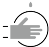
食材を扱う際の手袋着用 Wearing Gloves When Handling Food