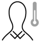
スタッフの体調管理 Staff's Health Care

当ホテルでは新型コロナウイルス感染症への対策の一環として、お客様と従業員の安全と健康を最優先に考え、以下の取り組みを実施しております。